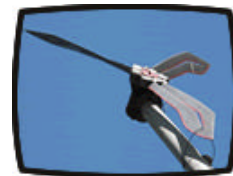
Un generador eólico autoproducido por Ufa Fabrik