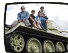
Encima de un tanque ruso situado al lado de un monumento en Berlín oeste