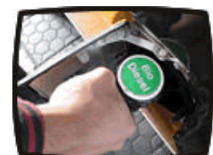
Reponiendo biodiesel en nuestra furgoneta