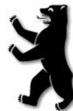
El oso negro emblema de Berlín

Y claro, con este ambiente mas standard, prefabricado y pizpireto, Los Ekogaia