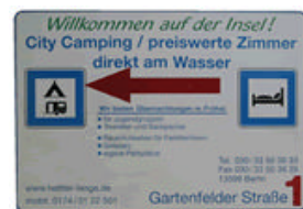
El panel a la entrada del camping donde pasamos 15 días