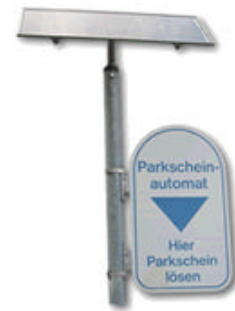
Maquina solar de un parking

Quizás podamos ver todo esto en un plazo de tiempo no muy largo también por estos lares.