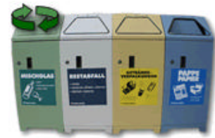
Contenedores de basura selectiva del metro