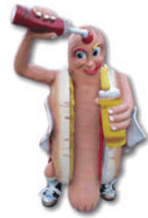
Un curioso logo de una hamburguesería de Berlín