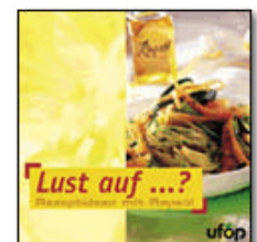
Información publicada por la UFOP sobre la colza