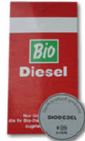
Una etiqueta característica del biodiesel